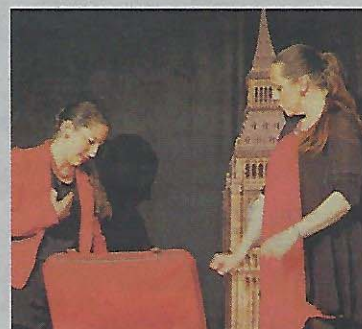
Kofferinhalt: Musik der schönsten Länder.